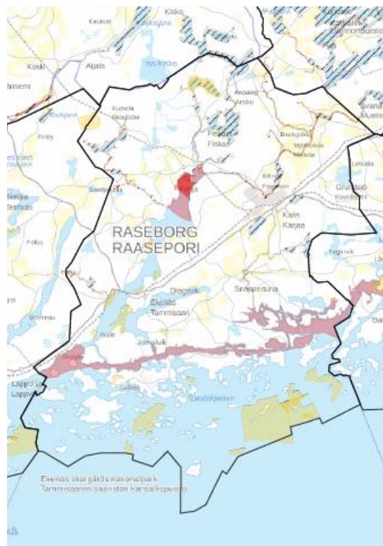
Karta från Paikkatietoikkuna 5.6.2020

Fiskeriområdets konstituerande möte hölls 4.2.2019 i Yrkeshögskola Novia, Ekenäs. Mötet som var sammankallat av NTM-centralen, godkände stadgar, valde styrelse, befullmäktigade fiskeövervakare, utsåg representant till den regionala fiskerisamarbetsgruppen och en tillfällig sekreterare. NTM-centralen fastställde fiskeriområdets stadgar 14.8.2019.