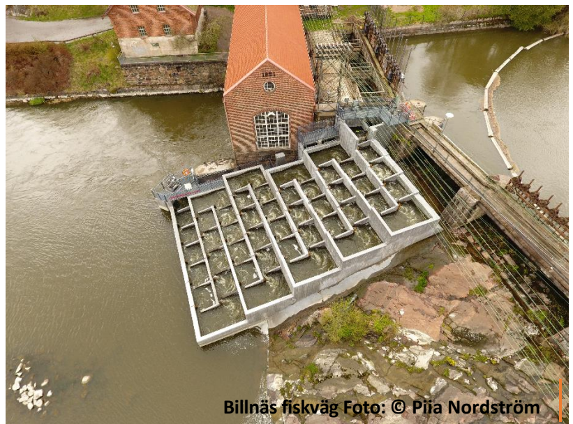
Billnäs fiskväg

Ekenäs-Snappertuna fiskeområde köpte år 2010 en båt med motor och utrustning för fiskeövervakning som nu används av fiskeriområdet. Båten används av övervakare Ken Thilman som också ansvarar för båtens skötsel. Thilmans huvudsakliga övervakningsområde är hela havsområdet utanför Pojo viken. Han arbetade under tiden 12.4-